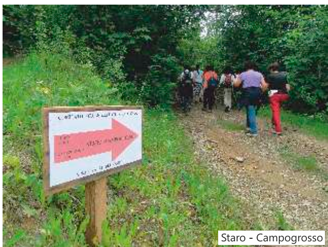
Staro - Campogrosso