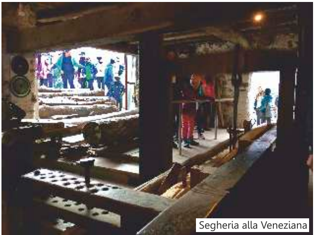
Segheria alla Veneziana