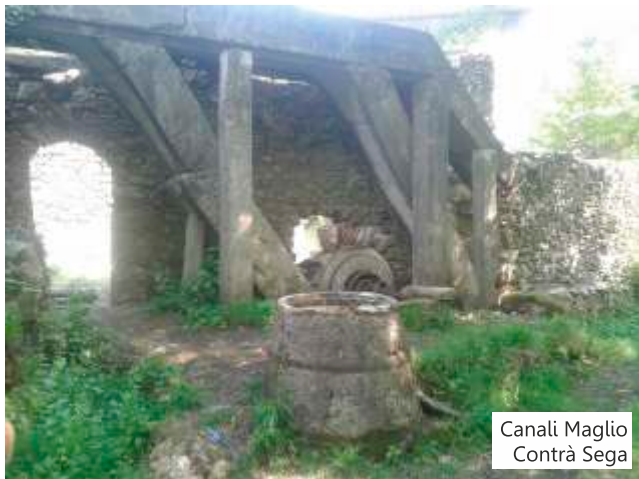
Canali Maglio Contra Sega