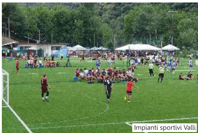
Impianti sportivi Valli